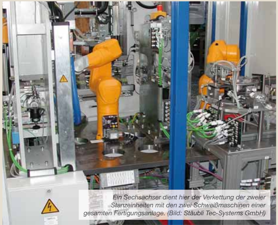
Ein Sechssachser dient hier der Verkettung der zweier Stanzeinheiten mit den zwei Schweißmaschinen einer gesamten Fertigungsanlage.

Das größte Potenzial für die Steigerung der Produktivität durch Fortsetzung der in den einzelnen Maschinen bereits erreichten Automatisierungsschritte ist im Transport zwischen diesen zu heben. In diesem Bereich ist es weit verbreiteter Standard, dass die Teile in Behältern gesammelt von einer Station zur nächsten gebracht werden. Per Stapler oder Transportwagen, in der überwiegenden Zahl der Fälle von Menschen. Auch wenn es zu vielen Maschinen bereits voll integriertes Zubehör zur Aufnahme des Vormaterials und zur Ablage der fertigen Teile gibt, beginnt und endet der Wirkungskreis der Automatisierung an der Schnittstelle zum Transportweg.