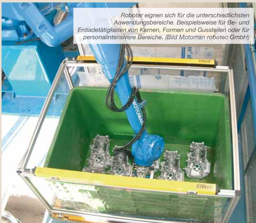
Roboter eignen sich für die unterschiedlichsten Anwendungsbereiche. Beispielsweise für Be- und Entladetätigkeiten von Kernen, Formen und Gussteilen oder für personalintensivere Bereiche.

Entwicklungen auf mehreren Gebieten zu einem Quantensprung geführt: Da ist zum einen die Antriebstechnik. Hier ist es mittlerweile Standard, alle Arten von Antrieben mit schnellen Bus-Schnittstellen auszustatten, ebenso mit Eigenintelligenz. Nicht nur kann damit auf unterschiedliche Anforderungen flexibel reagiert werden, vor allem was den Einsatz platzsparender Antriebe für den jeweiligen Zweck betrifft, es ist durch die Dezentralisierung auch gelungen, Antriebe bis weit in die Peripherie hinaus direkt in die zentrale Automatisierung der eigentlichen Maschine zu integrieren.