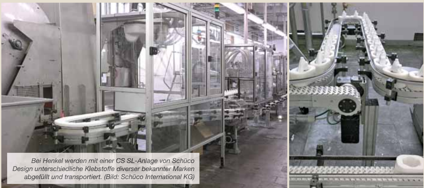
Bei Henkel werden mit einer CS SL-Anlage von Schüco Design unterschiedliche Klebstoffe diverser bekannter Marken abgefüllt und transportiert.